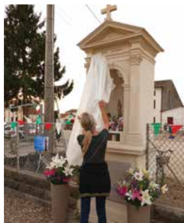
10) 13 giugno 2022. Inaugurazione del Capitello dedicato a Sant'Antonio presso via Frassenara