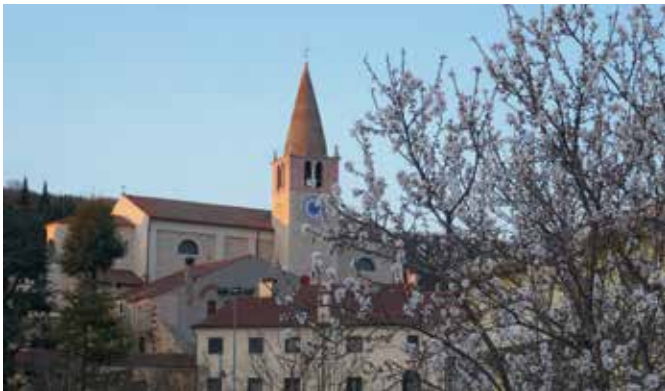
3) 7 febbraio 2022. Mandorli in fiore..