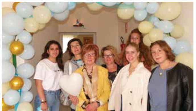
6) 29 maggio 2022. Inaugurazione saletta parrocchiale di Pilastro.