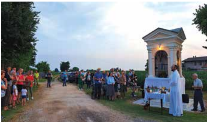
5) 26 maggio 2022. Fioretto in Contrà Ronego