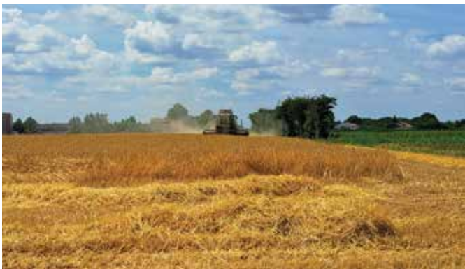
7) 8 giugno 2022. Trebbiatura in via Albarolo.