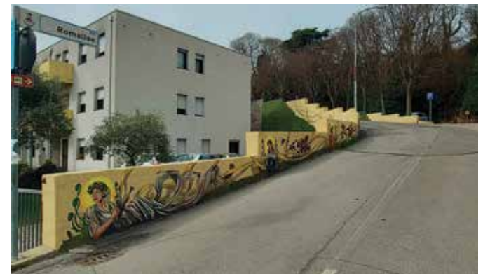
4) 18 marzo 2022. Murale dei Promessi Sposi.