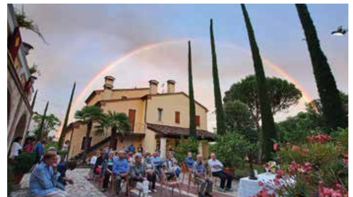
8) 9 giugno 2022. Messa e arcobaleno presso il Colle dell'Iris.