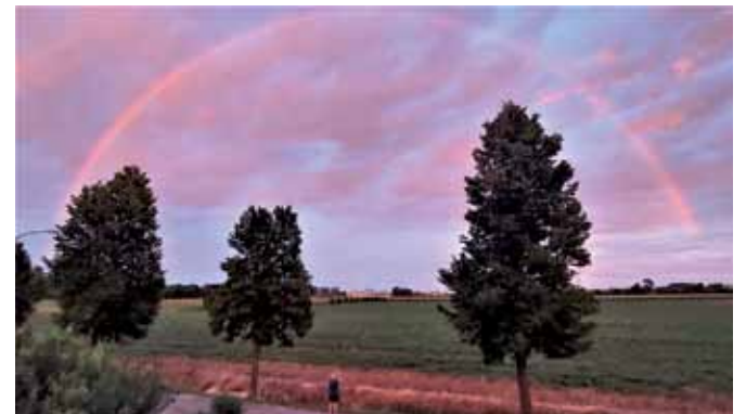
8) 17 luglio 2021. Un arcobaleno intero in cielo