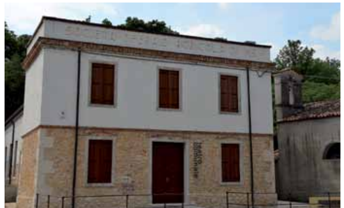
Lo scorso 27 maggio è stata ripristinata la storica scritta "Società Operaio Agricola di Mutuo Soccorso", visibile anche nella foto di una processione risalente al 1954. Tale scritta è stata realizzata in pietra di Vicenza dopo un attento studio da parte dell'ufficio tecnico e dell'amministrazione comunale.