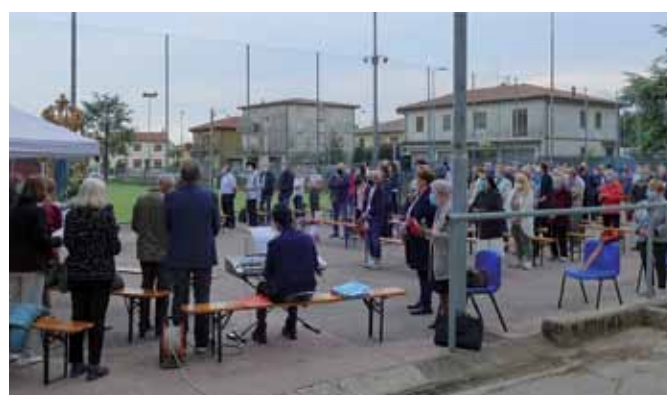
4) 29 maggio 2021. Messa di chiusura al parco della Casa della Gioventù.

SCEGLI OGGI IL TUO FORNITORE LUCE E GAS DI DOMANI