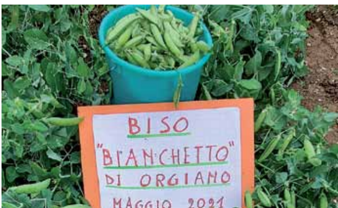
11) 25 luglio 2021. I prodotti della nostra terra: le cipolle di via Perara e il "biso bianchetto" di via Fontanelle