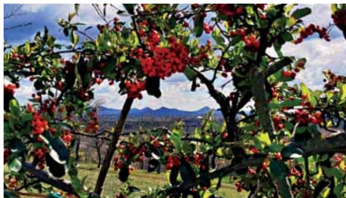
2) 18 marzo 2021. È alle porte la primavera. Uno scatto da via San Silo.