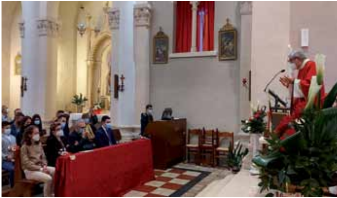
5) 2 maggio 2021. Celebrazione della Cresima a Pilastro.