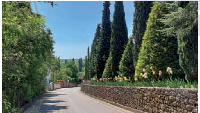
6) Maggio 2021. Via Castello e il colorato Colle dell'Iris