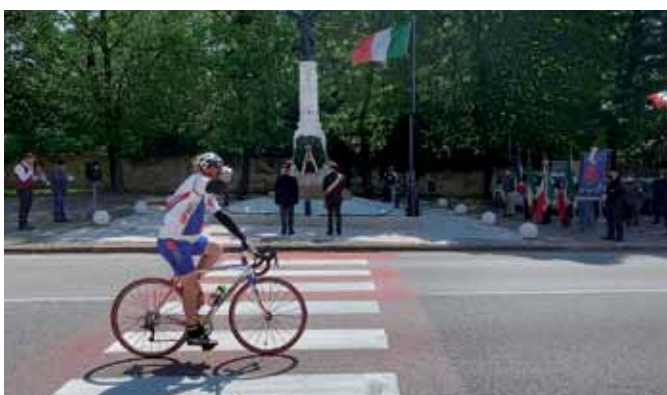
3) 25 aprile 2021. Durante le celebrazioni il passaggio di un ciclista dal nobile gesto.