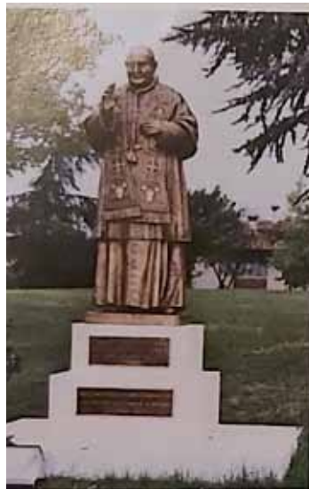
Monumento a Papa Giovanni XXIII°