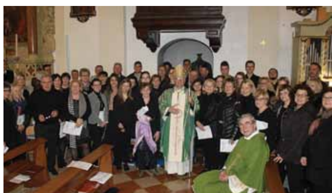
Visita del vescovo Beniamino Pizzol ad Orgiano. Domenica 10 febbraio 2019