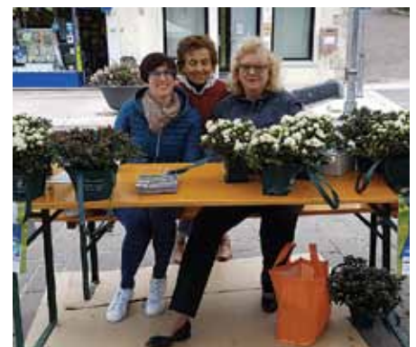
Gruppo di volontari AIRC nella vendita delle "Azalee della Ricerca". Sabato 11 maggio 2019