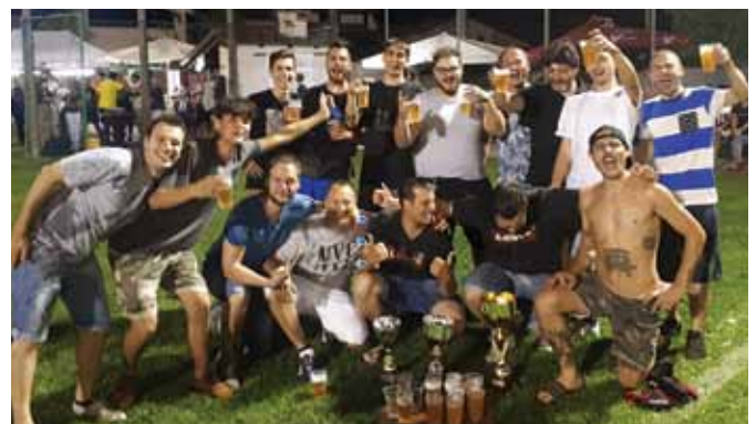
Giovani orgianesi del "Birra Real" in festa dopo la vittoria al torneo di Sant'Andrea. Sabato 29 giugno