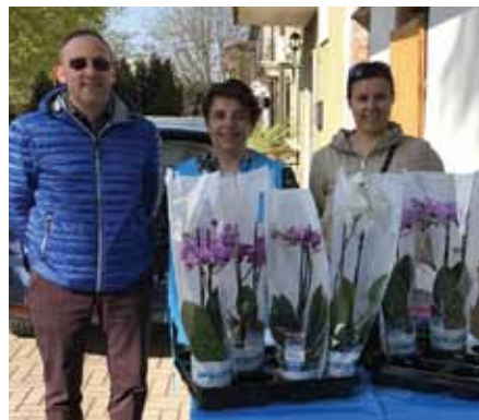
Vendita di beneficenza delle Orchidee ONLUS a Pilastro. Domenica 31 marzo 2019