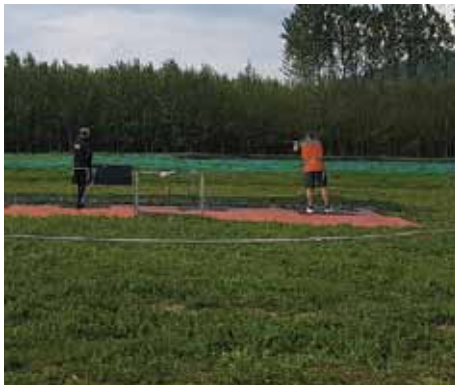
Weekend di tiro a volo in località Palù organizzata dall'ANUU. Maggio 2019