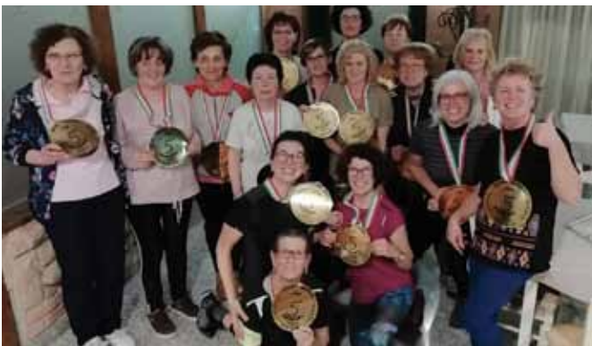
Gruppo di sportive alla fine dell'anno dedicato alla ginnastica dolce. Maggio 2019