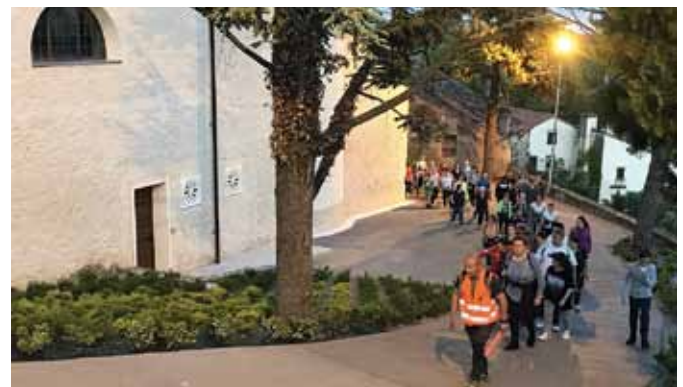
Numerosi partecipanti alla passeggiata in notturna "Notte di fuoco". Sabato 1 giugno 2019