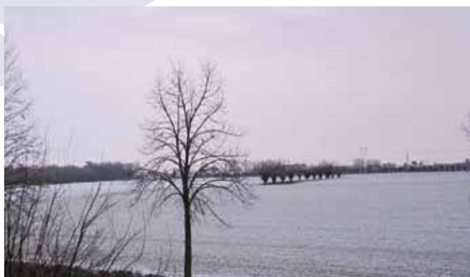
Nevicatina in via Fontanelle (l'unica dell'inverno). Mercoledì 23 gennaio 2019