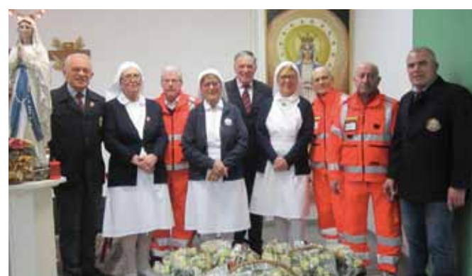
Festa del Malato alla Casa di Riposo "S. Giuseppe". Lunedì 11 febbraio 2019