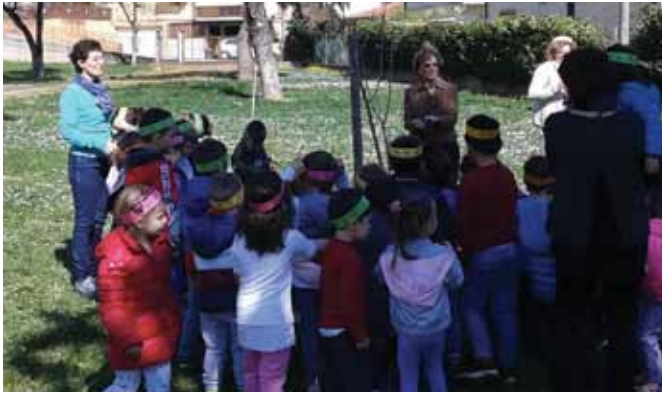
Festa degli alberi presso la Scuola dell'Infanzia "M. Immacolata" di Orgiano. Venerdì 29 marzo 2019