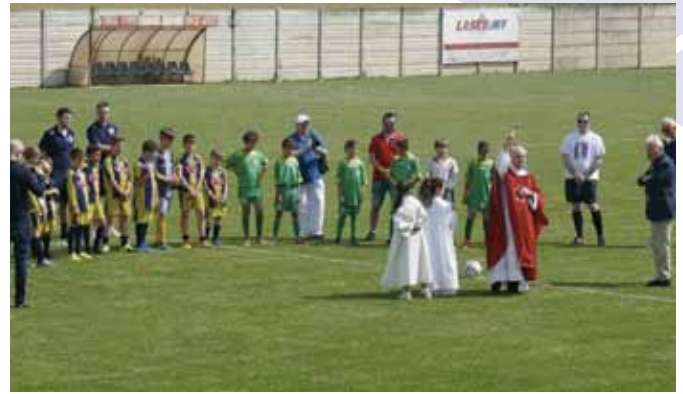
8° Trofeo Don Romeo. Calcio a 7 Pulcini. Domenica 9 giugno 2019