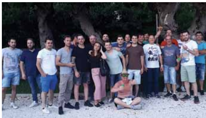
I partecipanti alla cena Veneta a tema "Spàrazi de monte", che si è tenuta presso "Le Fontanelle". Lunedì 15 giugno 2019